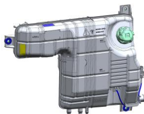
Imagem 1 – Vista 3D